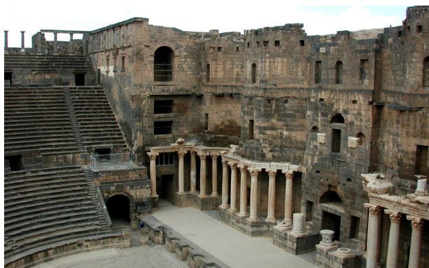
Théâtre de Bosra (juin 2001)

Bosra : le Théâtre romain (IIe - début IIIe siècle), fortifié à l'époque musulmane (fin XIe - milieu XIIIe siècle), occupé depuis le 25 mars 2015 par le Front al-Nosra, contient beaucoup d'objets antiques dont on craint l'éparpillement frauduleux.