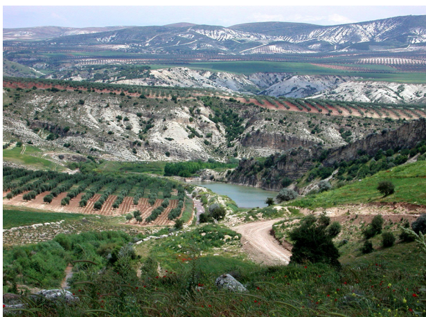
La région d'Afrin à Cyrrhus (juin 2001)

terroristes entre eux, pour les faire partir vers Idlib. Autre acteur important : la Russie qui veille à préserver avant tout la souveraineté de l'état syrien. Rappelons que l'armée syrienne a été formée depuis longtemps par les Russes et que les relations remontent loin dans l'histoire contemporaine. Russie et Syrie ont des intérêts stratégiques communs. La Turquie a envahi le nord ( région de l'Afrin ) pour créer une zone de sécurité sans