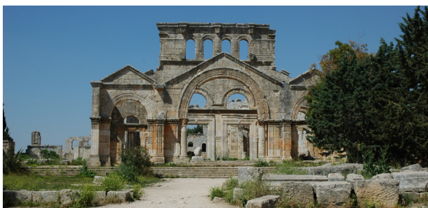
Saint-Siméon-le-Stylite (mai 2009 ;)

Saint-Siméon était devenu au Moyen-Age un lieu de pèlerinage consacré au stylite et thaumaturge Siméon, qui s'y était fixé sur une colonne en 415 et qui y mourut en 459. Ce sanctuaire, le plus vaste d'Orient avant l'érection de Sainte-Sophie de Constantinople, couvrait 12000 m 2 . L'itinéraire rédigé par un pèlerin anonyme de Bordeaux au Ve siècle montre que les pèlerins occidentaux se rendaient à Alexandrie par bateau puis au Sinaï avant de gagner Jérusalem et de revenir par l'Anatolie en passant à Saint-Siméon, doté de trois hôtelleries et de la fameuse église cruciforme élevée par l'Empereur Zénon autour de la base de la colonne du saint stylite. Les miliciens du Front Al Nosra se sont livrés en l'occupant à de nombreuses déprédations.