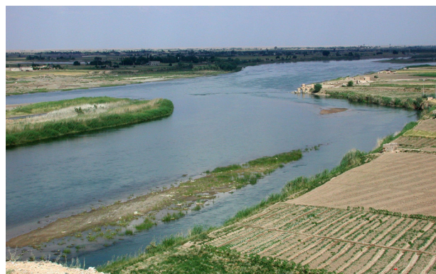
L'Euphrate à Doura-Europos (juin 2001)

Doura-Europos , appelée par l'historien M. Rostovtzeff «la Pompéi du désert syrien», marquait la limite de l'Empire romain séparé par l'Euphrate de l'Empire parthe, puis perse, qui s'en empara en 256 et la ville fut livrée depuis aux vents et aux sables. La synagogue exceptionnellement décorée de fresques avait été transportée dans les années 1930, au Musée Archéologique National de Damas; l'équipe franco-syrienne du Professeur Pierre Leriche s'est consacrée à dégager les nombreux monuments (dix-neuf temples, plusieurs palais) de cette cité bâtie sur une falaise qui dominait le fleuve de 40 mètres. Malgré des campagnes de fouilles qui n'ont pas cessé depuis 1920, une petite partie seulement du site a révélé de nombreux documents qui mettent en valeur le rapprochement helléno-oriental. Aussi, depuis que les miliciens de Daech occupent la région, on peut imaginer le pillage de ce lieu exceptionnel. C'est ainsi que le récent musée de site a été détruit et pillé.